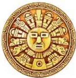
Símbolo de sol (Inca, Perú y Clima)