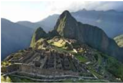
Santuario Histórico de Machu Picchu (Inca, Perú y orgánico)

El imagotipo del Sello Nacional de la producción orgánica consiste en una forma circular hueca color tono amarillo que sugiere el diseño preincaico del sol, refiriendo al concepto “inca” (Perú) y “clima”, dentro de esta forma se aprecia otra forma de colores degradé de tonos azules a verdes, de izquierda a derecha, que refiere a una de las maravillas del mundo y sitio arqueológico más representativo del Perú, el Santuario Histórico Inca de Machu Picchu, refiriendo a los conceptos “suelos”, “inca” (Perú) y “orgánico”. Asimismo, al lado izquierdo se observan tres formas que aducen al concepto de “mar” y al lado derecho, de tres formas de hojas de planta, para reforzar el concepto “orgánico”. Entre ambas formas se ubican dos textos, ambos en color tono verde, en la parte superior “Orgánico”, en tanto que, en la inferior, “Perú”.