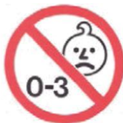
图 A.1 年龄警告的图标

对3岁以下儿童可能构成危险的首饰应附警告，例如：“警告：不适合3岁以下儿童佩戴”或“警告：不适合36个月以下儿童佩戴”或采用图A.1图标。